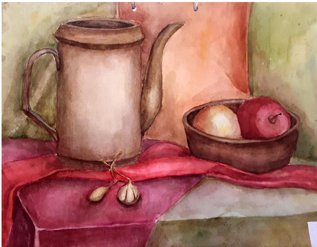
2. Тема: Натюрморт в холодной гамме (3-4 предмета)